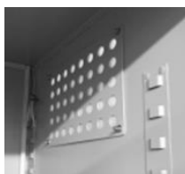
Ventilations naturelles hautes et basses avec filtre à poussière